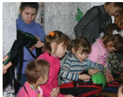
Дети из Центра “Надежда”