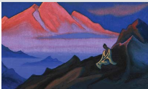
Н.К. Рерих. Мысль

1. Мысли человека могут возникать произвольно, помимо воли, и затруднять